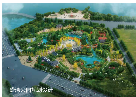
盛湾公园规划设计