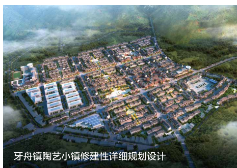
牙舟镇陶艺小镇修建性详细规划设计