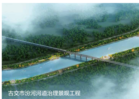
古交市汾河河道治理景观工程